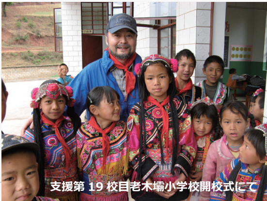
支援第19校目老木壩小学校開校式にて

認定 NPO 法人日本雲南聯誼協会「50の小学校プロジェクト」では、雲南省山岳地帯の貧しい少数民族地域に、安全で衛生的な小学校をプレゼントしています。皆様のご支援のお陰で2001年からこれまでの間に22校が無事開校しました。