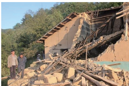
昨年 9 月の昭通伊良地震では、 大きな被害が出ました