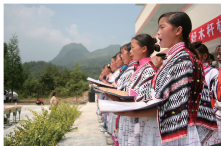
クリスチャンのミャオ族たちは 賛美歌で歓迎してくれます

昭通は中国中央と雲南を結ぶ「南方シルクロード」の要所。今でも昔ながらの街並みに、ミャオ族、彝族、プイ族など多彩な民族が暮らしています。