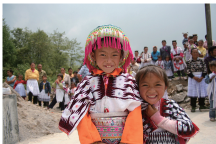
木杆小学校ミャオ族の姉妹。 今回、5年ぶりの再会となるかも！？

2013 年 5 月 4 日 ( 祝 ) ~ 10 日 ( 金 ) 6 泊 7 日 訪問予定地 : 雲南省昭通市大関県